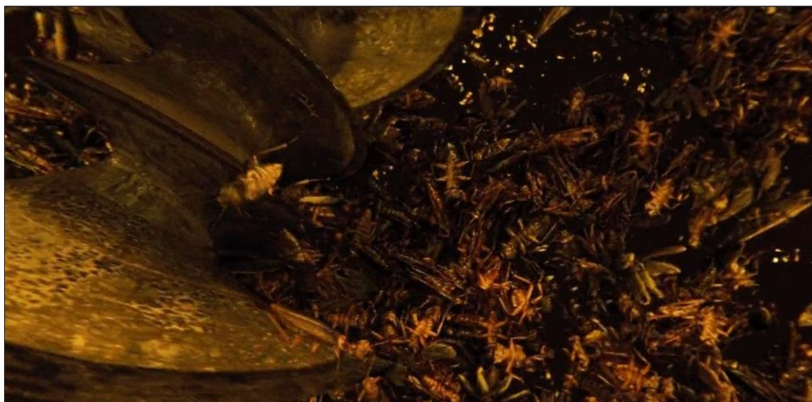
Ил. 6. Технология изготовления протеиновых батончиков из синантропных насекомых для жителей «хвостовой» части Поезда мистера Уилфорда. Кадр из фильма.