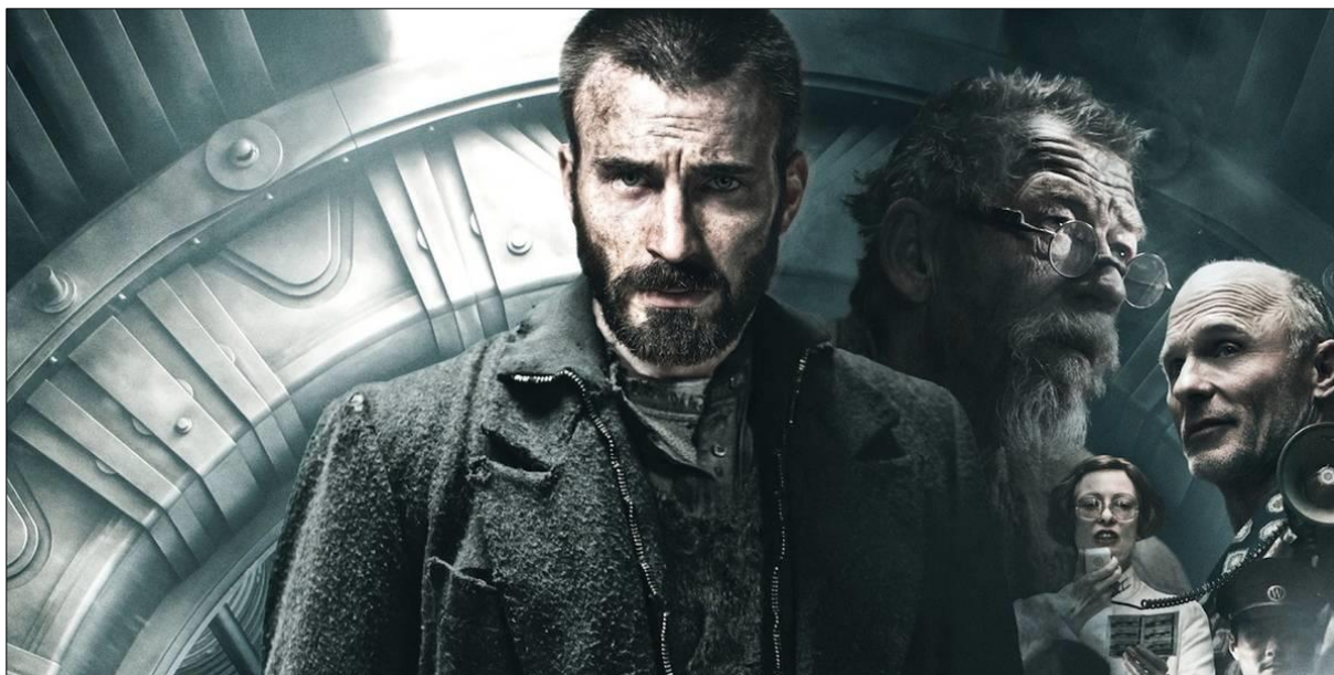
Ил. 7. Участники самого глубинного и загадочного PR-проекта train-общества – бунтарь Кертис, старик Гиллиам, министр Мейсон и мистер Уилфорд. Постер к фильму.

Таким образом, формирование Кертиса как главного «хвостового» революционера происходило под непрерывным влиянием архетипической диалектики Живого и Вымышленного «Отца», что придавало всему процессу индивидуации Кертиса-Героя явный и неоспоримый сакральный оттенок (ил. 7).