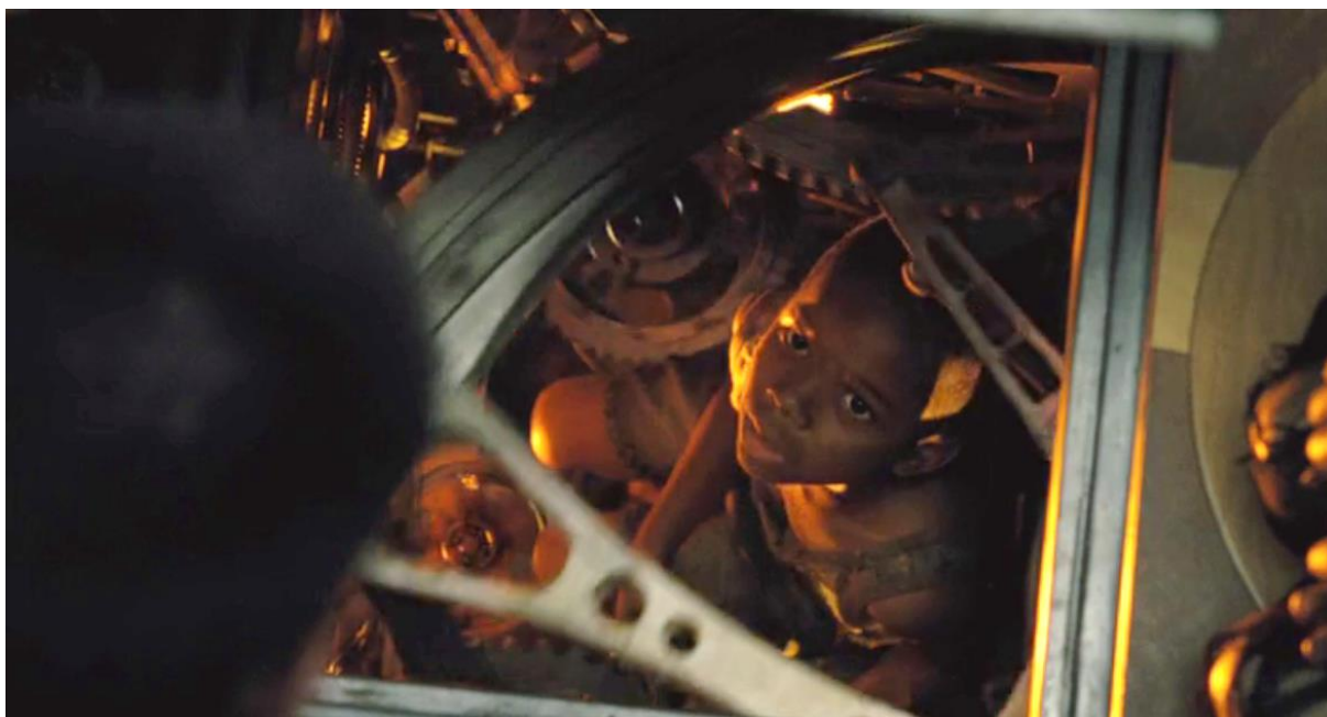
Ил. 10. Мальчик Тим из Хвоста выполняет функцию «живого механизма» в Священном Двигателе Поезда мистера Уилфорда. Кадр из фильма.

«обычно геронтократия возникает, когда официальный лидер не уверен в себе и боится более молодых. Подтягивая к себе таких же старых и не уверенных в себе, как он сам, и делаясь с ними властью, он формирует старческую верхушку, для которой страх потерять власть перевешивает стремление править единолично» [Дольник, 1993: 75].