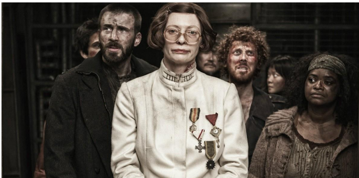
Ил. 8. Министр Мейсон – Темная Мать бунтаря Кертиса. Кадр из фильма.

а просто пойти к мистеру Уилфорду и самому лично во всем разобраться (ил. 8). Следует отметить, что сама министр Мейсон, несмотря на ее жестокость и демонстративное пренебрежение к узникам Хвоста, для Кертиса выступала той самой юнгианской Темной «Матерью». Именно она, через демонстративное отрицание материнской модели все-таки способствовала реализации негативистского сценария формирования у него созидательной установки в отношении как самого себя, так и всего train-общества. Именно это качество и выделяло Кертиса среди всех остальных поездных изгоев, придавая ему, его жизни и борьбе возвышенный смысл и веру в победу.