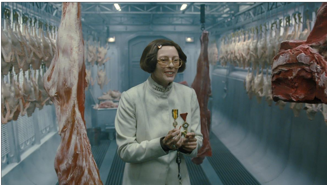
Ил. 5. «Душа была давно дешевле мяса» [Волошин, без даты]. Трофические экстремумы train-общества: элитная пища для «головных» вагонов. Кадр из фильма.

как и все остальные узники этого состава, включая бесправных изгоев «хвостовых» вагонов.