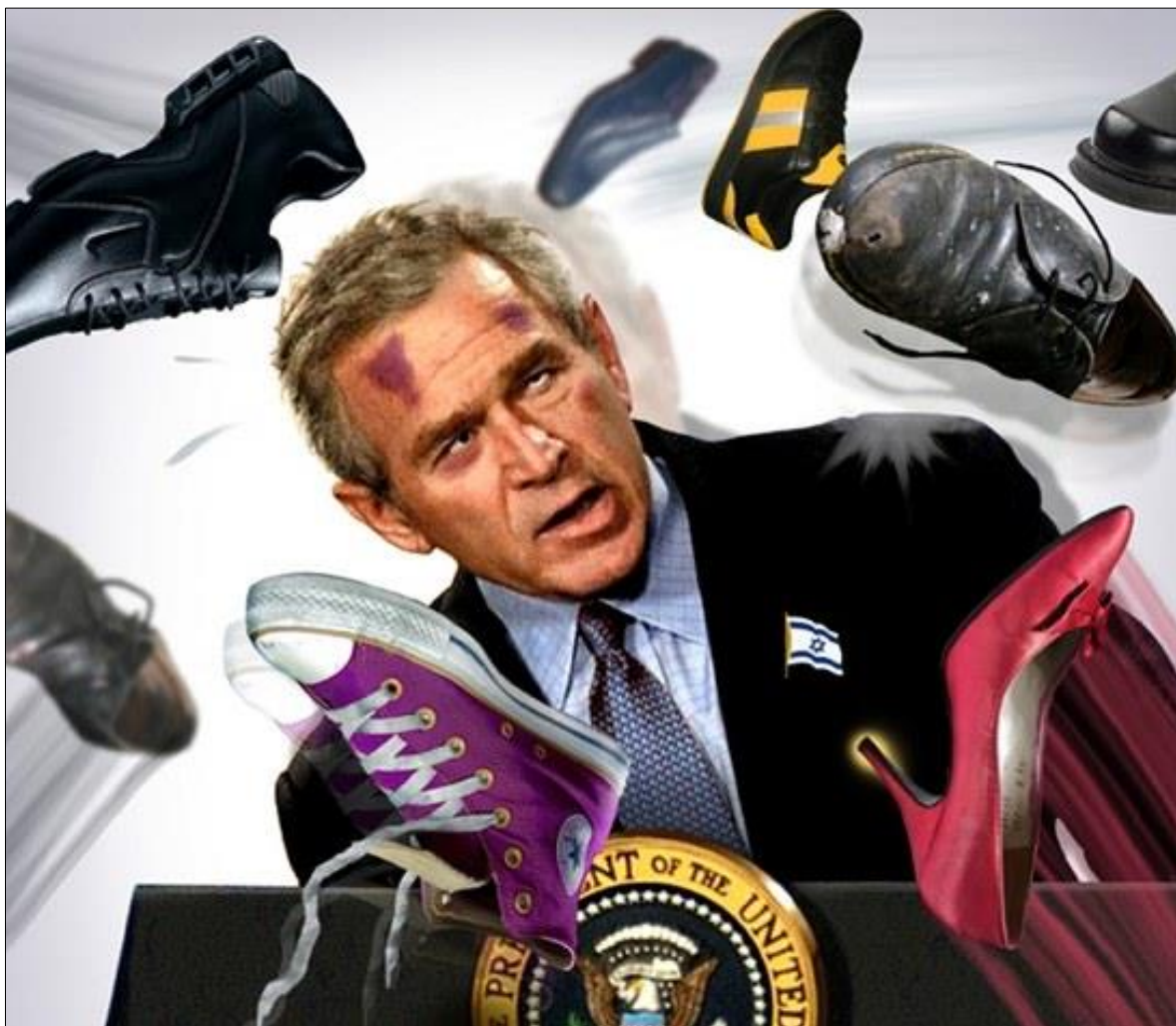
Ил. 4. Сатирический мем о Джордже Буше мл., в которого журналист Мунтазар Аль-Зейди запустил ботинком.

Подобные действия в целом соответствовали традиционным и признанным ритуалам чистоты и недоверию к обуви, да и вообще к нижним частям тела человека, которые непосредственно соприкасаются с землей. В отличие от головы, которая находится наверху и является чистой, ноги и обувь напрямую всегда взаимодействуют с грязью и нечистотами, а потому все, что с ними связано, в странах Ближнего Востока является крайней формой проявления неуважения. Показательно,