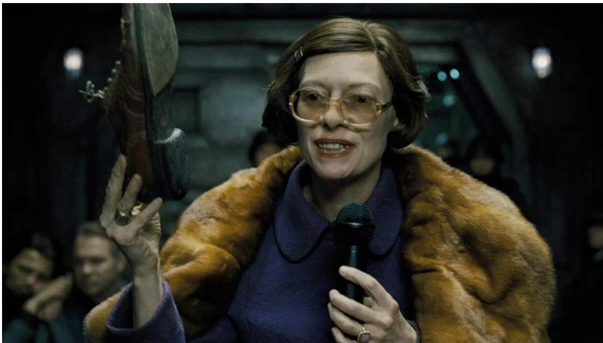
Ил. 3. Министр Мейсон с ботинком в руках утверждает приоритеты социальной иерархии в train-обществе Мистера Уилфорда. Кадр из фильма.

Авторы уверены, что в этом месте своих рассуждений следует обратиться к очень интересной аналогии, непосредственно связанной с сюжетным поворотом анализируемой нами картины. Речь идет об очень известном инциденте, произошедшем с президентом США Джорджем Бушем 14 декабря 2008 года на его пресс-конференции в столице Ирака Багдаде, который также включал в себя эпизод бросания ботинка из толпы в американского лидера. Произошедшее событие напрямую отсылает нас к традициям мусульманской культуры, которая однозначно интерпретирует подобные действия как крайнюю форму оскорбления. Журналист Мунтазар Аль-Зейди в момент броска обуви гневно прокричал Джорджу Бушу: