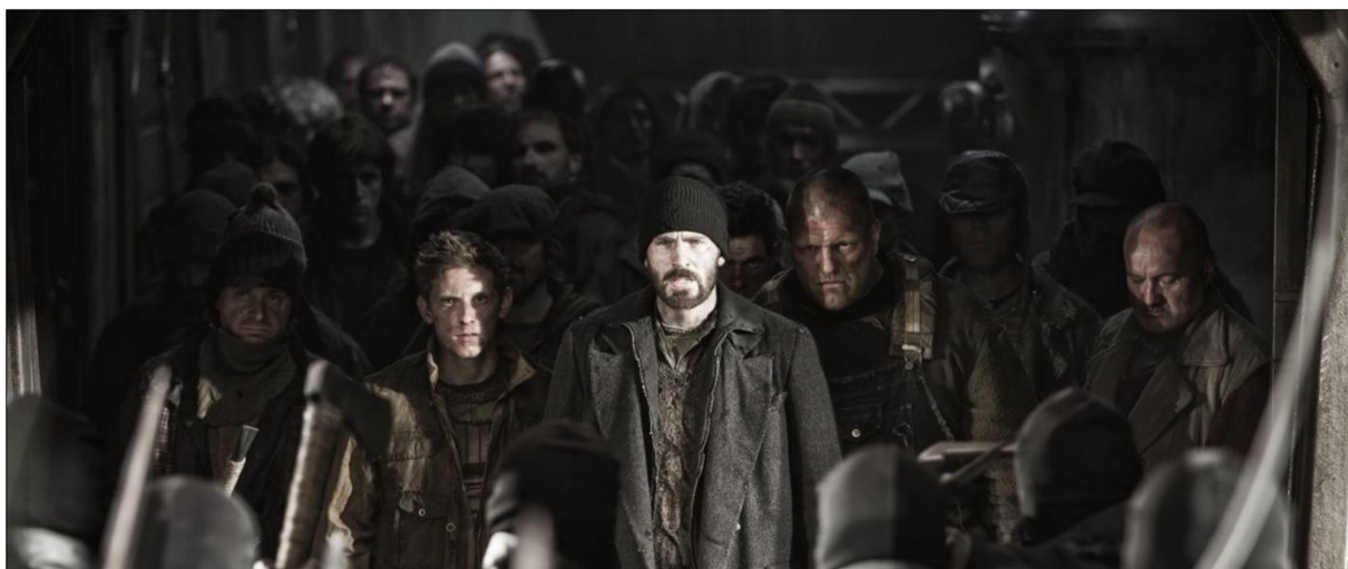
Ил. 2. «Так лишь на битву построились оба народа с вождями <...>» [Гомер, без даты].

Однако со временем драматичные события последнего и решающего бунта, который возглавил Кертис, позволили открыть доселе неведомую сторону личности Гиллиама. Оказывается, он изначально был давним другом мистера Уилфорда, и именно им обоим принадлежит авторство сценариев всех заранее срежиссированных, а потому и безуспешных революций-бунтов Хвоста против Головы (ил. 2).