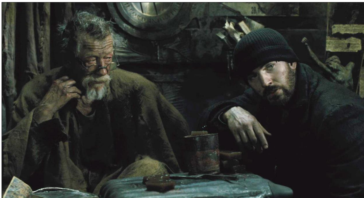
Ил. 1. Гиллиам и Кертис за обсуждением сценариев захвата Головы. Кадр из фильма.

отрезать себе руку и предложить ее для съедения Кертису. Эта ситуация демонстрирует особую архетипическую миссию Гиллиама во внутреннем мире юного Кертиса, которую тот пронес через всю историю собственной индивидуации: от рождения к зрелости, от Хвоста к Голове Поезда мистера Уилфорда (ил. 1).