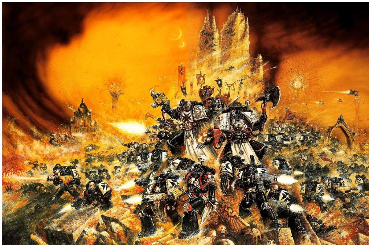
Ил. 1. Войны ордена Черных Храмовников, одних из самых фанатичных космодесантников, или как на самом деле выглядят цисгендерные белые мужчины со стороны противников традиционных семейных ценностей.

Сам же объединитель человечества, бывший поначалу атеистом, становится в итоге Богом-Императором и объектом фанатичного религиозного поклонения (ил. 1).