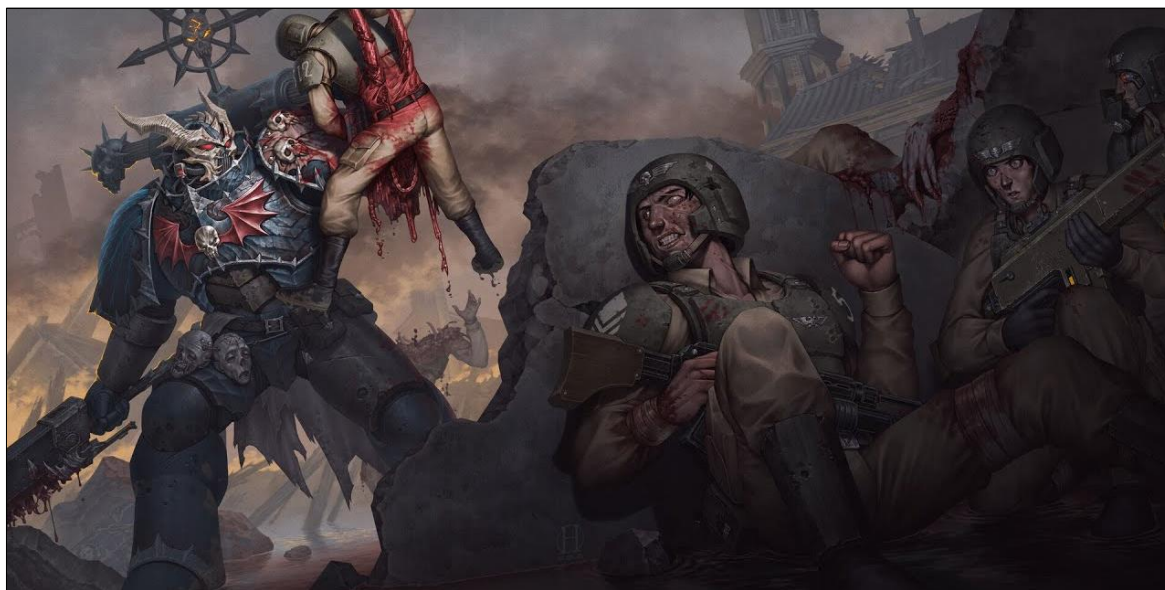
Ил. 6. Космодесантник-хаосит из легиона «Повелителей Ночи» проводит очередной акт террора против местного населения, или как же все-таки выглядит альтернативный путь в «светлое» будущее... Изображение размещено в свободном доступе по ссылке: https://clck.ru/3QdjCI

раз они не следуют узколобым законам техножрецов, то, наверное, они и есть те самые «хорошие». Тогда как все мрачные, монструозные образы – лишь ирония, для демонстрации недалекости хаоситов и дополнительной «демонизации» тех, от кого они откололись. Однако, не все обстоит так просто! На деле же «последователи» – это игрушки, пешки, инструменты для Губительных Сил. Они пробуждают самые разрушительные стороны своего адепта, побуждая его на все большие и большие безумства. При этом альтернативный путь может быть ничем не лучше предложенного в Империи, а, возможно, даже и намного страшнее (ил. 6).