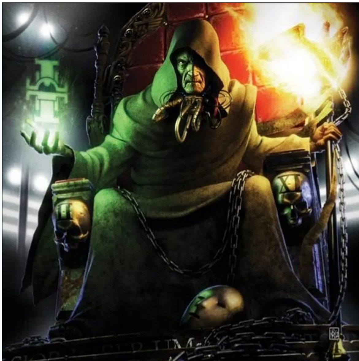
Ил. 8. Малкадор Сигиллит – регент Имперiums, или как же все-таки выглядит настолько умный «дядька», от разговоров с которым приходит в восторг сам Император.

подданных для борьбы с тайными агентами предателей. Другая же версия заключается в инициативе двух доверенных лиц Императора, которые приняли решение не вмешиваться в ход событий в противовес двум другим, посчитавшим необходимым найти способ во что бы то ни стало воскресить своего лидера (ил. 8).