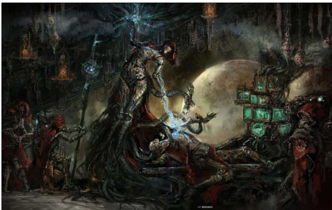
Ил. 3. Иконоподобное изображение «Прикосновение Омниссии», или «мечтают ли техножрецы о техномессии?»

При встрече с культом Механикус Бог-Император был признан техножрецами как Омниссия (примерно, как Мессия, но только от Бога-Машины) [Культ Механикус, без даты]. Он не просто поминается в молитвах, он входит в троицу, почитаемую указанным культом (Бог-Машина, Омниссия и Движущая Сила... Никому ничего не напоминает?..). Бог-Император, таким образом, поминается в молитвах не только более привычных клерикалов, но и почитается техножречеством, которое возводит его на пьедестал в качестве «технологического совершенства» (ил. 3).