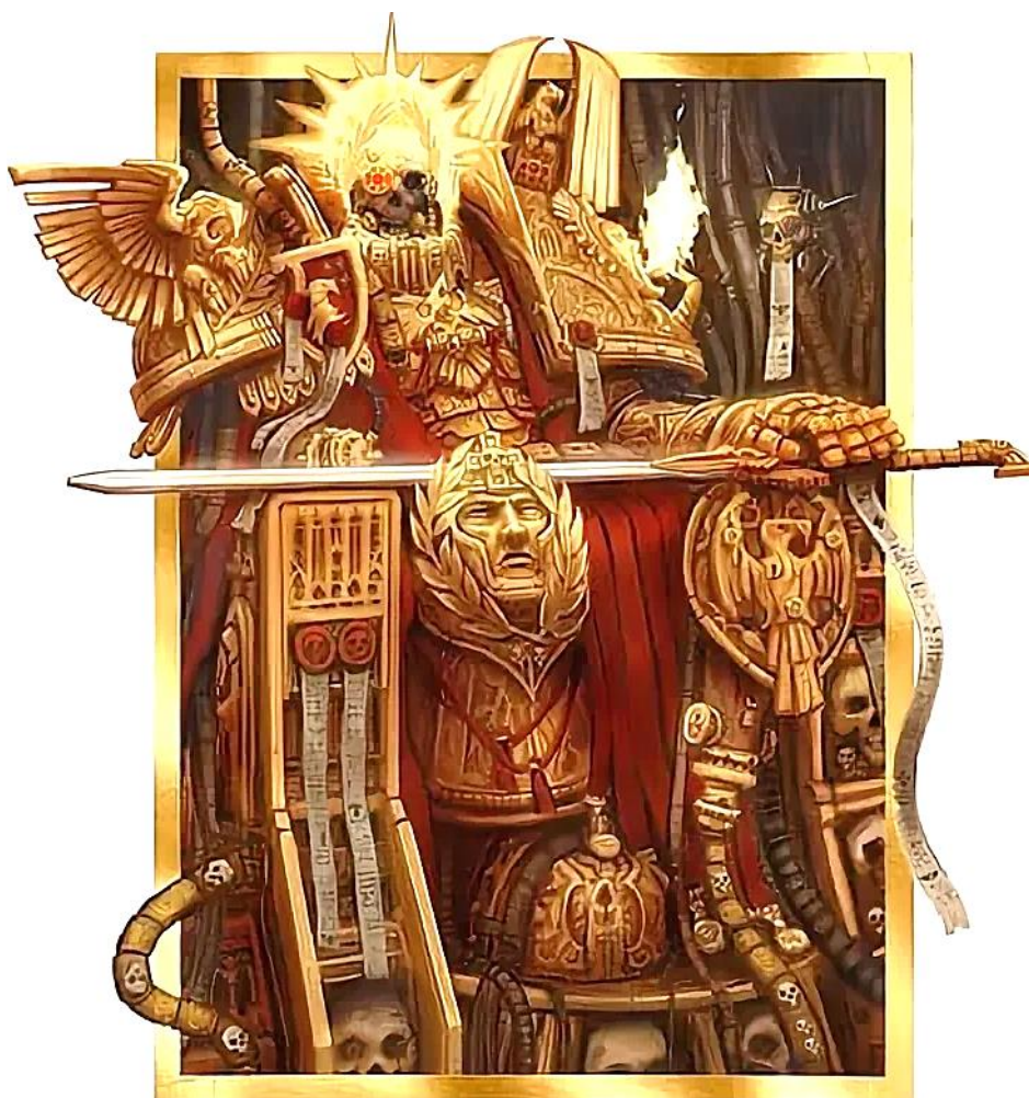
Ил. 2. Бог-Император – спаситель человечества, или о том, как выглядит, так и не воскресшее божество Империи людей. Изображение размещено в свободном доступе по ссылке: https://clck.ru/3QLfxw

для сирот, в которых воспитывают будущих священников, монахинь, чиновников, офицеров (и т. д.) [Схола Прогениум, без даты]. Министорум шефствует над монашескими организациями Адепта Сороритас [Адепта Сороритас, без даты], которые занимаются боевыми операциями от лица церкви, дипломатическими миссиями, селекцией аристократов, полевой и гражданской медициной и многим другим. Миссионеры несут весть о спасителе человечества «во все концы» вселенной [Миссионария Галаксия, без даты] (ил. 2).