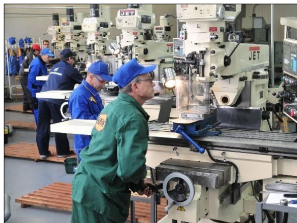
Ил. 13, 14. Сервиторы на производстве и фото рабочих за станками, или «не вздумай жаловаться, а не то сделаем из тебя лоботомированного киборга-раба, ввиду чего ты больше в принципе не сможешь ни на что жаловаться».

Изображения размещены в свободном доступе по ссылкам соответственно: