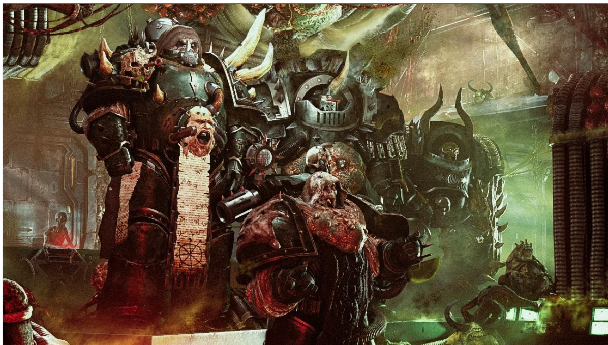
Ил. 7. Космодесантники-хаоситы из легиона «Гвардия смерти» готовые нести «вечную жизнь» через вечное разложение.

После прохождения черты невозврата душа хаосита неизбежно преобразуется в свое новое, основательно выжженное грехами обличие (ил. 7).