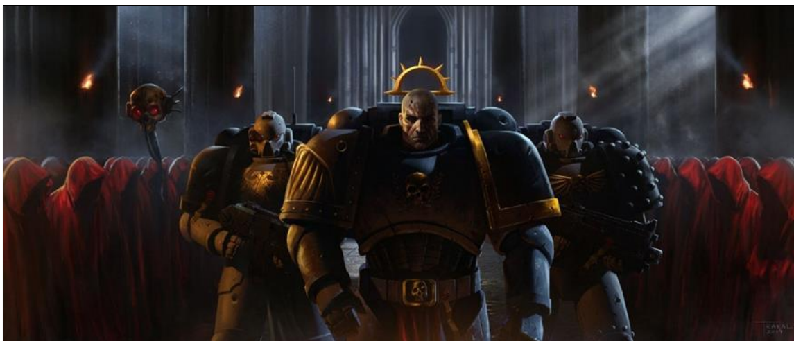
Ил. 4. Простые смертные расступаются, склоняя головы перед «внуками» Императора, или как выглядят «главные модники на районе».

Можно сказать, они его условные внуки (если Примархи – дети Императора, а они – чада Примархов). Космодесантники относятся к Императору как к высшему вождю, что создает самые различные конфликты между фанатиками Министорума и Адептус Астартес. Ведь если они (космодесантники) являются ангелами Бога-Императора, то как же они могут не признавать в нем бога, да еще и лгать, если они его кровь и плоть? С другой же стороны, никто из лояльных суперсолдат никогда не усомнится в благодетельности и абсолютной правоте своего вождя и косвенного родственника (ил. 4).