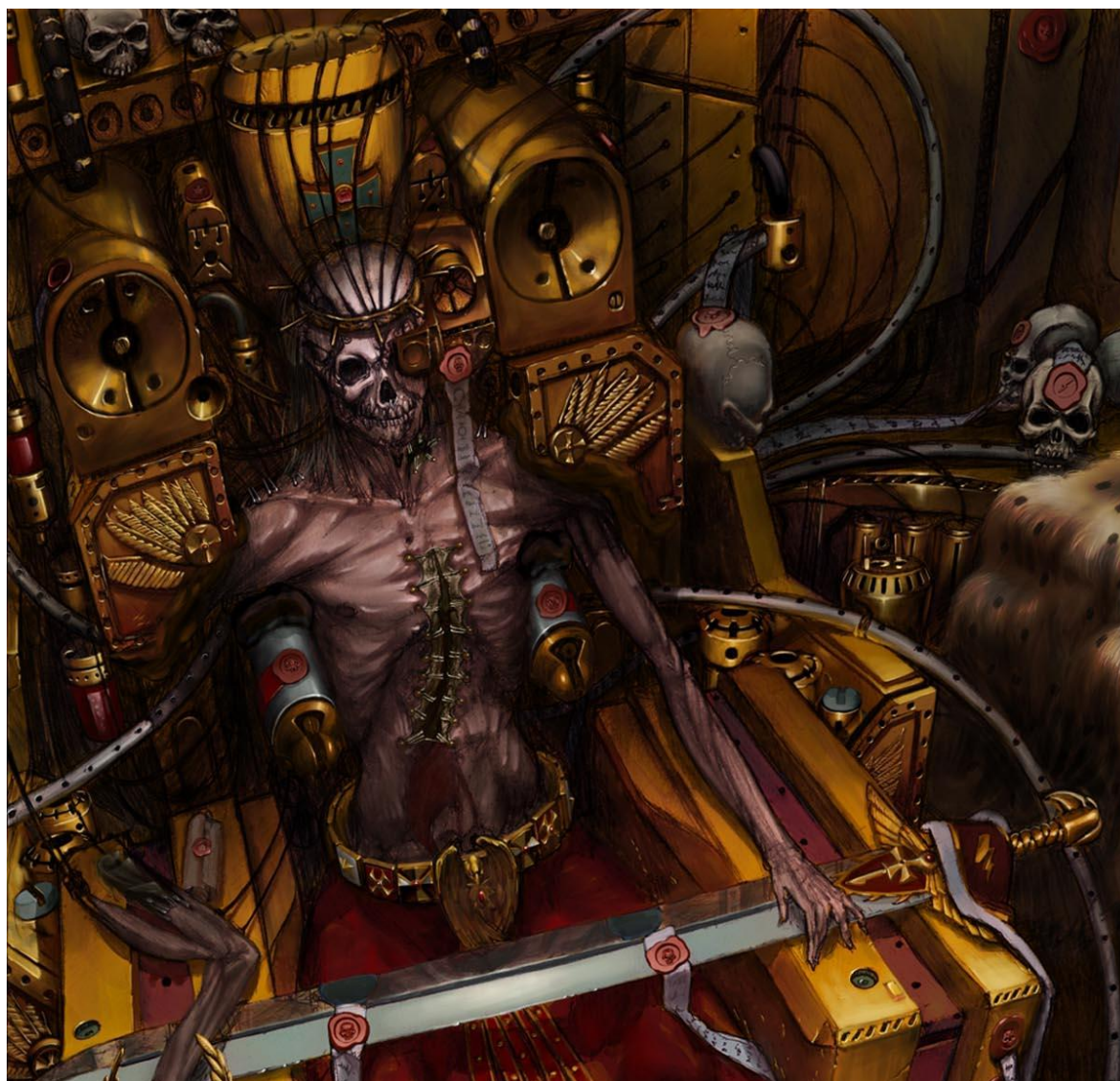
Ил. 11. Инквизитор-радикал Квиксос сражается с инквизитором Грегором Эйзенхорном, или о том, как «уже радикал» спорит о методах с «еще пуританином».

Следовательно, уже сам факт наличия интереса к той или иной символической вселенной может быть отражением более глубокой связи с действительностью и социальной реальностью, в которой находится игрок.