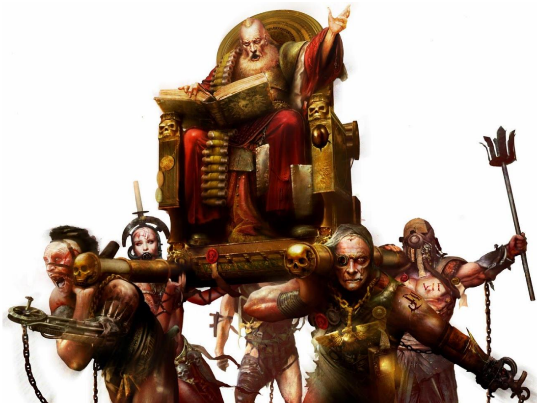
Ил. 10. Проповедник в паланкине несет свет Бога-Императора, или как выглядит тариф такси «Комфорт+» в пространстве игры Warhammer 40000. Изображение размещено в свободном доступе по ссылке: https://clck.ru/3QMB0N