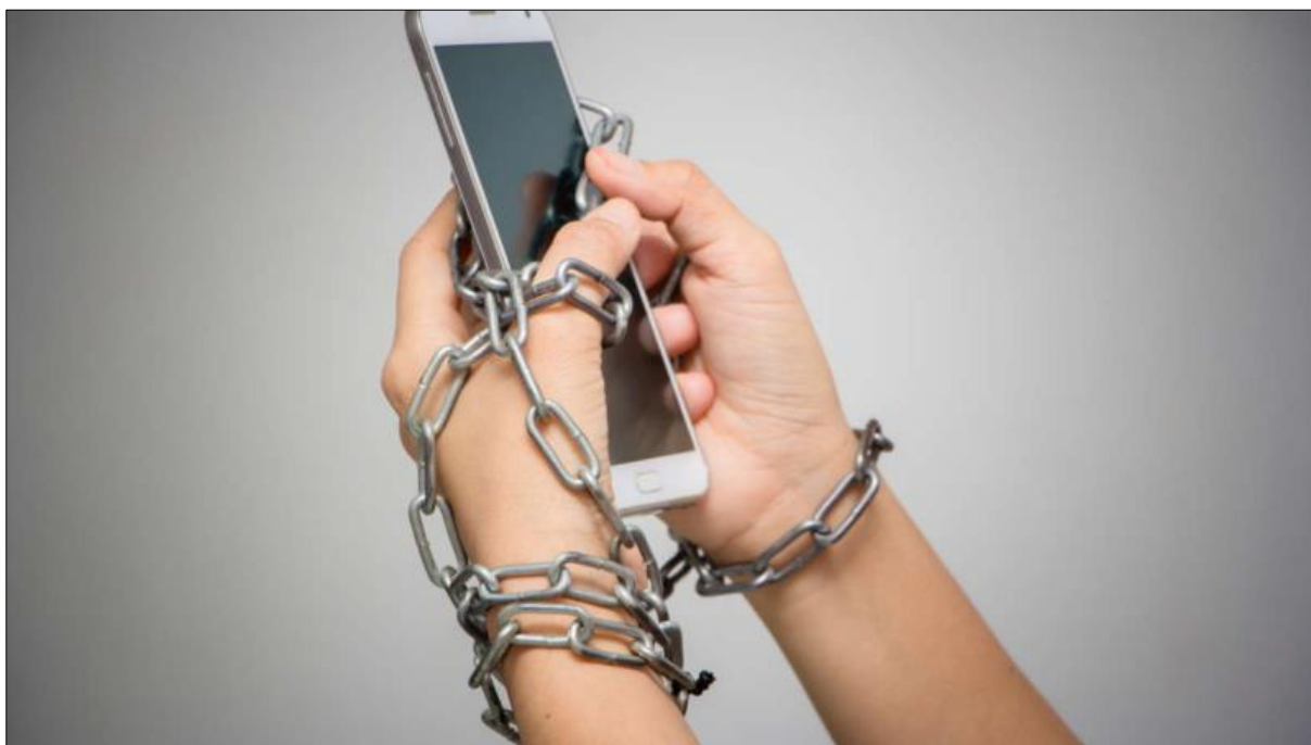
Ил. 11. Скованные одной цепью... «Рабы» гаджетов в цифровом плену теней своих виртуальных пещер.

аллегии пещеры как состояния человека, глубоко погруженного в мир теней виртуального мира (ил. 11). Антропологическая