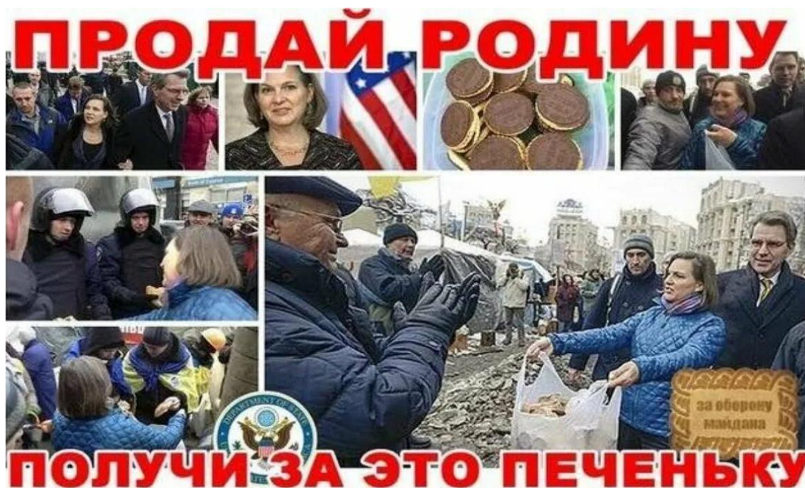
Ил. 6. Акция: «Продай Родину – получи «печеньки» от Госдепа США». Или политическая риторика на службе уничтожения неудобных режимов, государств и народов. Фотоколлаж по поводу событий на Украине 2013–2014 гг.