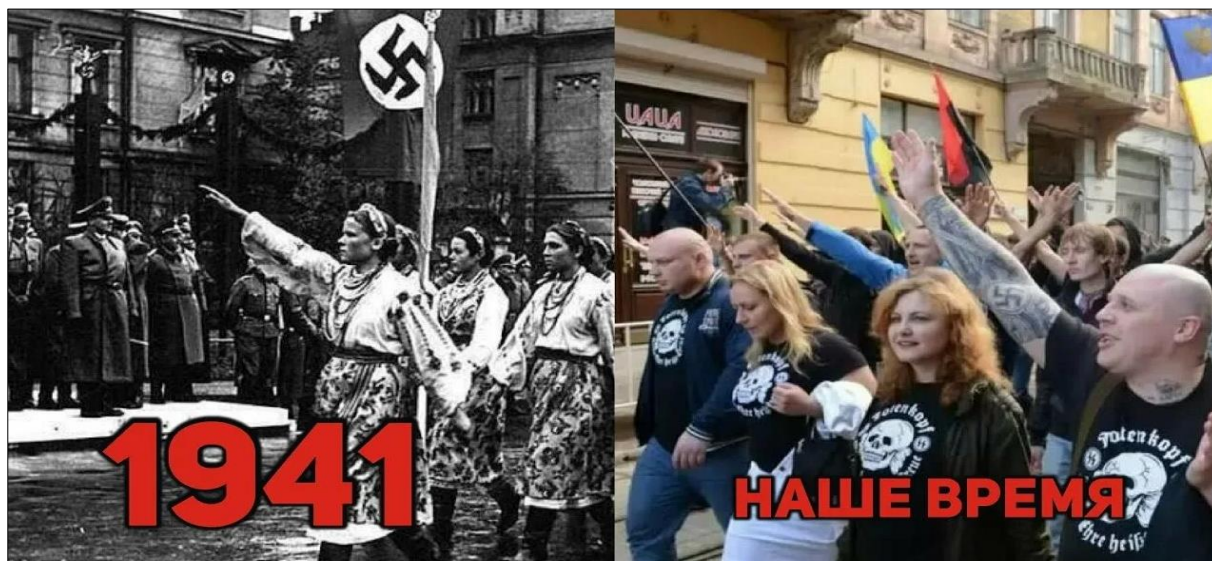
Ил. 4. Физическая ремифизация мифического опыта уже не только потенциальная опасность, о которой в свое время заявлял Г. Блюменберг, но и кошмарная политическая и медийная реальность современной Европы. В современной России подобные действия подпадают под действие статьи УК РФ 282.4. Неоднократные пропаганда либо публичное демонстрирование нацистской атрибутики или символики, либо атрибутики или символики экстремистских организаций, либо иных атрибутики или символики, пропаганда либо публичное демонстрирование которых запрещены федеральными законами. Изображение размещено в свободном доступе на платформе: https://www.stoletie.ru/upload/medialibrary/319/foto-k.jpg

Г. Блюменберг сделал этот пример видным и актуальным образцом, опираясь на интерпретацию Мартином Хайдеггером аллегории пещеры, правда, с дополнениями к этой интерпретации Вальтера Брекера, ученика Хайдеггера и учителя самого Г. Блюменберга. В случае с Блюменбергом бесплодие всех учений неизбежно приводит к периодически повторяющимся вспышкам политического насилия и даже к физической ремифизации мифического опыта (ил. 4), который, как теперь выясняется, не был ни в должной мере освоен, ни до конца преодолен, несмотря на катастрофические и чудовищные примеры из мировой истории XX века.