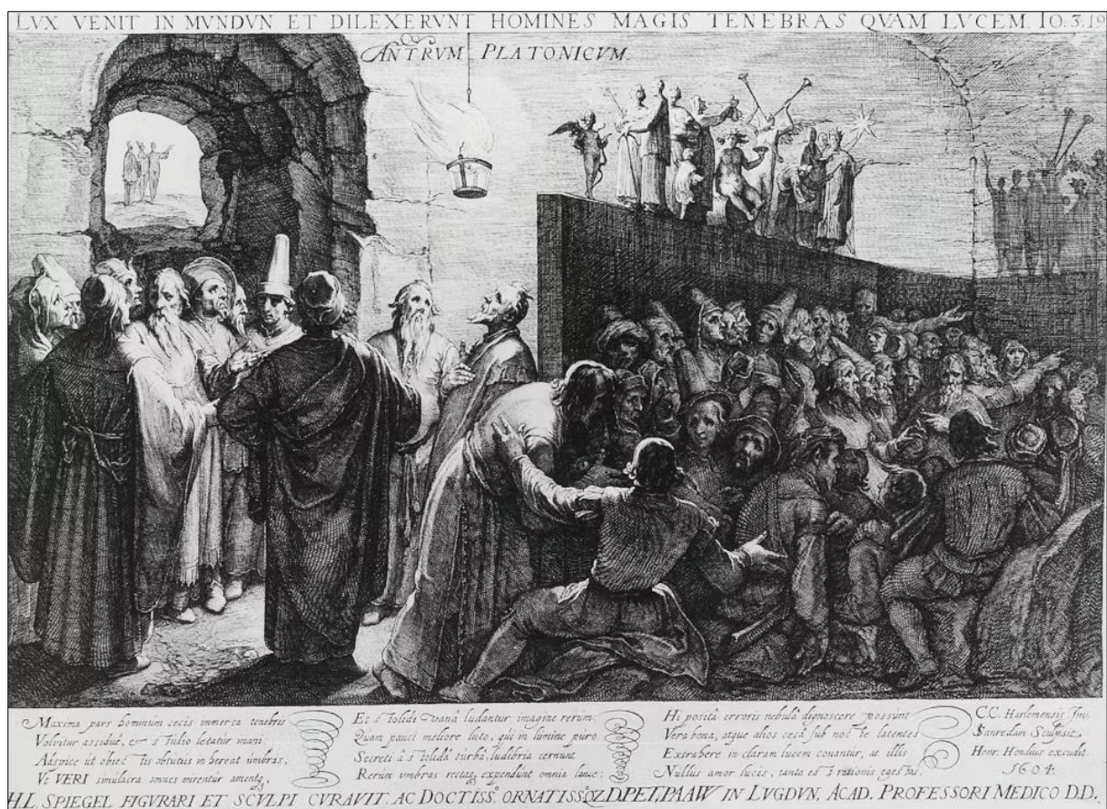
Ил. 1. Причта о пещере Платона – новая реальность в постмодернистскую эпоху, или история о том, как истина слепит, а впечатления завораживают. Ян Санредам. Antrum Platonicum («Платонова пещера», оттиск, 1604 г., Британский музей, Лондон).

на обеспечение идеологического господства посредством целого спектра индустрий впечатлений (ил. 1).