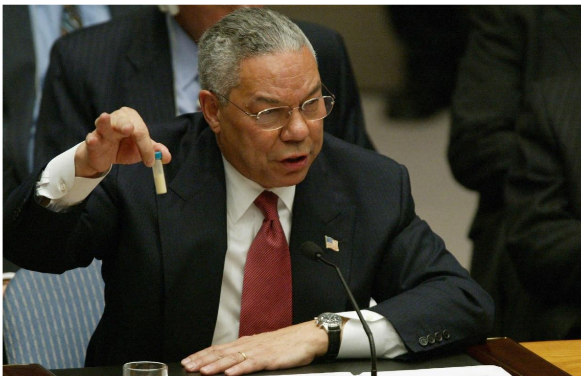
Ил. 7. Ложь, шантаж и политика, или вот как рождаются гомункулусы сначала риторических, а затем и настоящих войн. Изображение размещено в свободном доступе на платформе: http://topwar.ru/uploads/posts/2015-12/1451424961_img17309.jpg