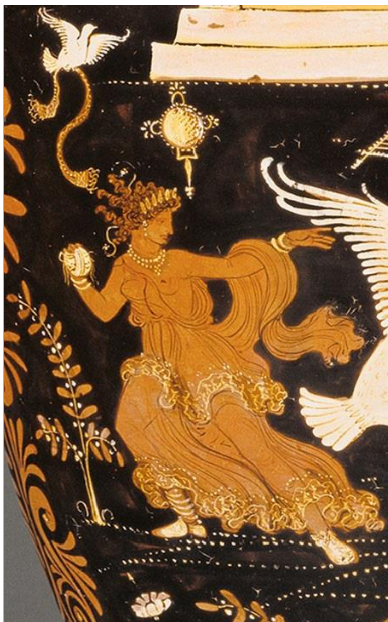
Ил. 10. Так вот как выглядит Пейто, спутница Афродиты, Океанида, дочь Океана и Тетиды, а по «совместительству» – богиня убеждения в древнегреческой мифологии. Пейто (Апулийская краснофигурная лутрофора, 4 век до н. э., музей Дж. Пола Гетти, Лос-Анджелес, Калифорния, США).

Пиетет по отношению языковой надежности при этом явно оказался в гораздо более выигрышном положении, а потому можно с полным основанием считать богиню Пейто (ил. 10) еще одним претендентом на образ антропологической риторики.