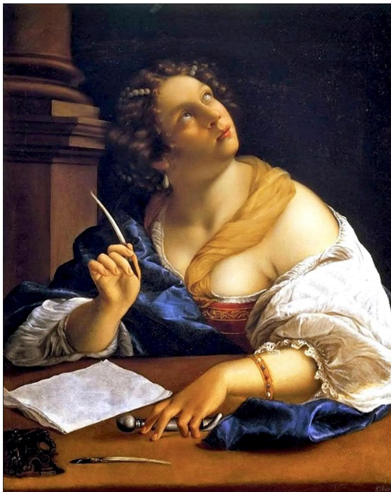
Ил. 8. Джентилески А. Аллегория риторики (1650 г., частная коллекция).

как это хорошо заметно на картине «Аллегория риторики», написанной итальянской художницей Артемизией Джентилески в 1650 году (ил. 8).