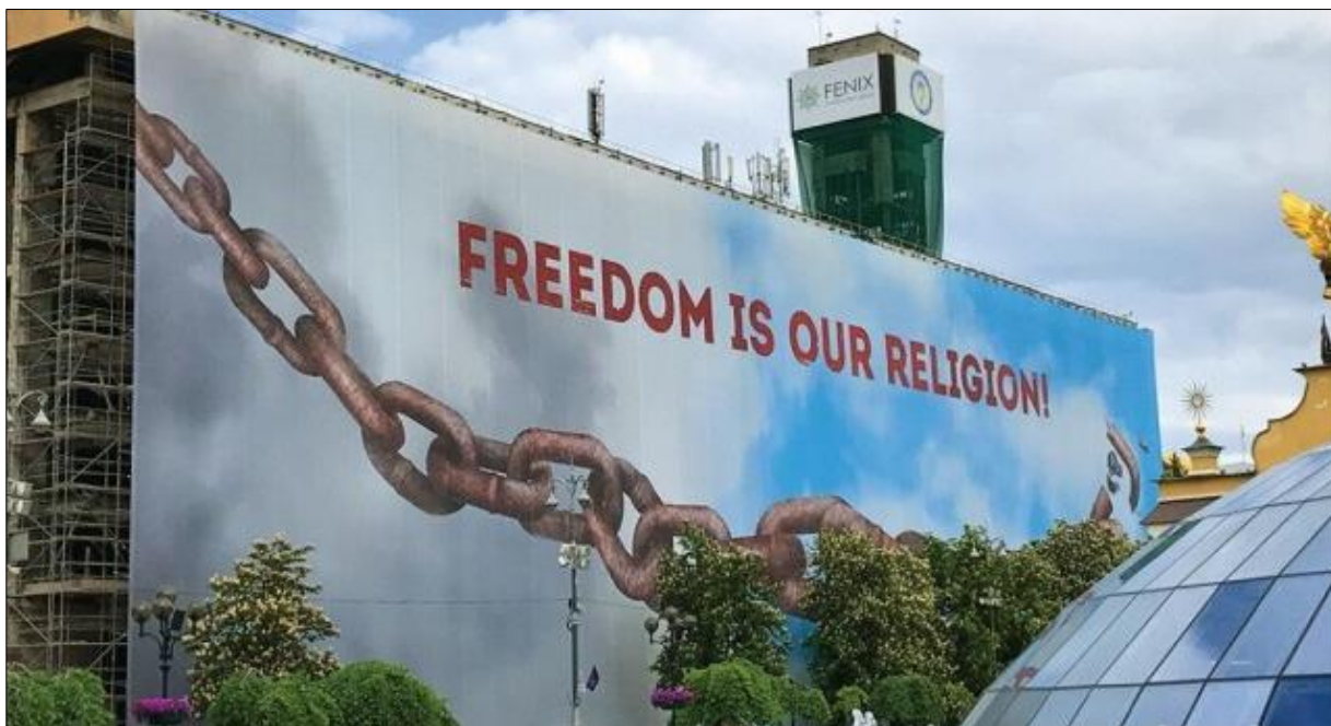
Ил. 5. «Свобода – это наша религия». Баннер на здании Дома Профсоюзов (г. Киев, Украина, 2014 г.).

К великому сожалению, такого рода примеров в современную эпоху фейков можно приводить бесконечное множество. К наиболее обескураживающим и опасным из них можно отнести реабилитацию политических режимов гитлеровских сателлитов, наглую ложь заместителя госсекретаря США Виктории Нуланд о ситуации на Украине с торжественной публичной раздачей на Майдане Независимости в Киеве 11 декабря 2003 года знаменитых «печенек» (ил. 6).