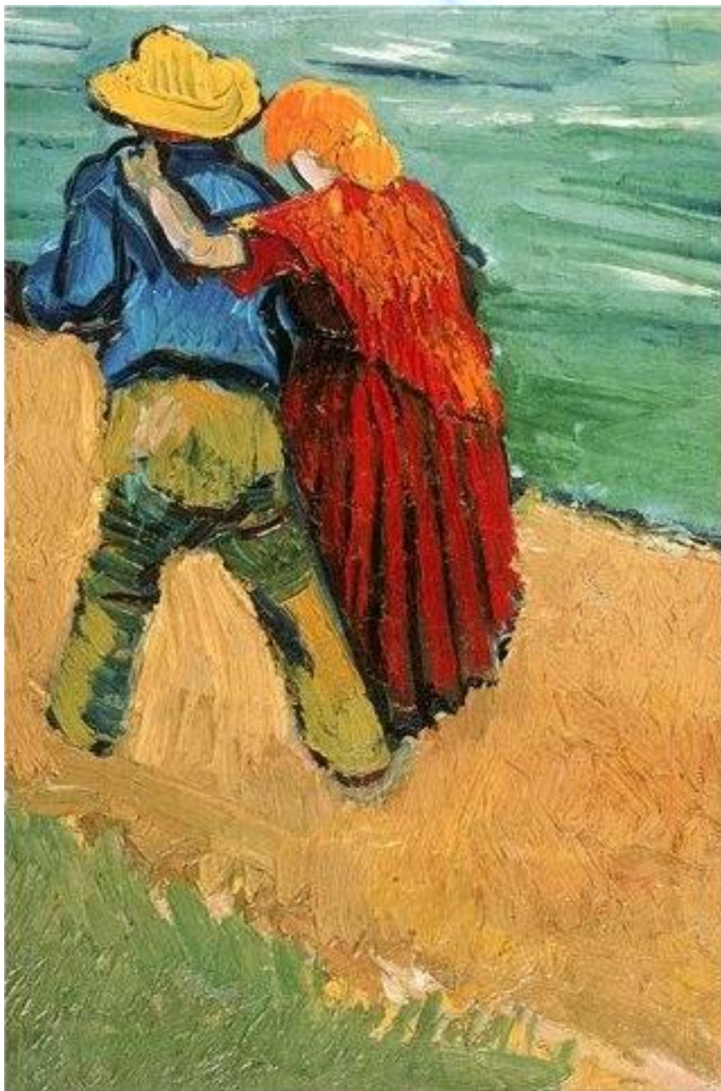
Рис. 1. Влюбленная пара, В. Ван Гог, 1888.

упоминают большое количество книг по этой тематике в личной библиотеке художника» [Цветкова 2015: 86]. С другой стороны,