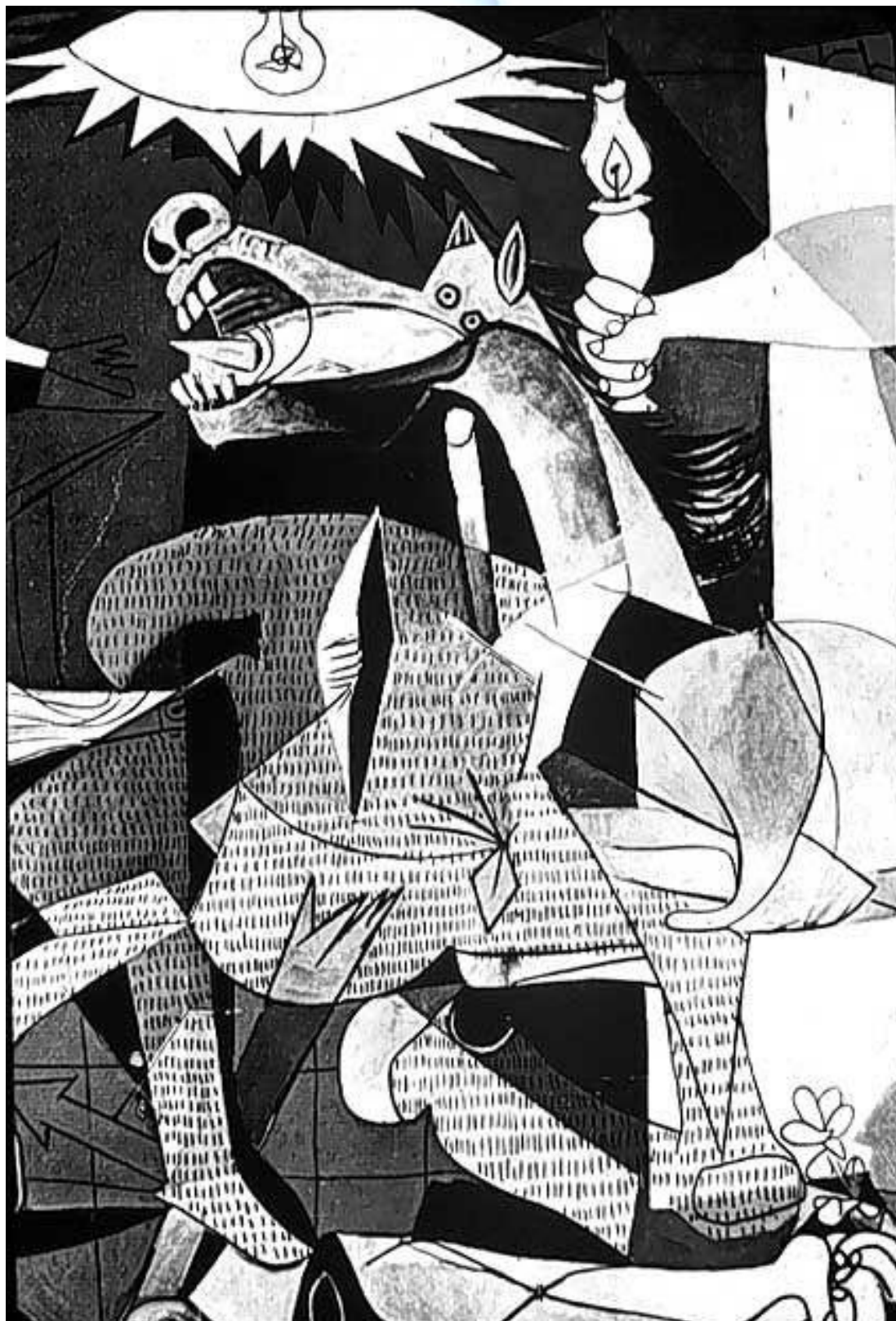
Рис. 3. Пикассо П. Герника, фрагмент, 1937.