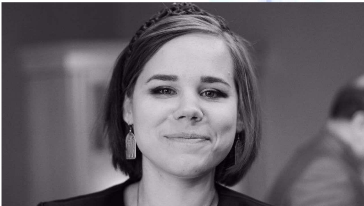
Улыбка философа.

Наши уважаемые коллеги из Крыма только что выпустили в свет удивительный сборник философской прозы и поэзии под названием «Русская мысль живет...» 6 , посвященный памяти трагически погибшей Дарьи Дугиной – российского философа, талантливого журналиста, общественного и политического деятеля, дочери Александра Дугина.