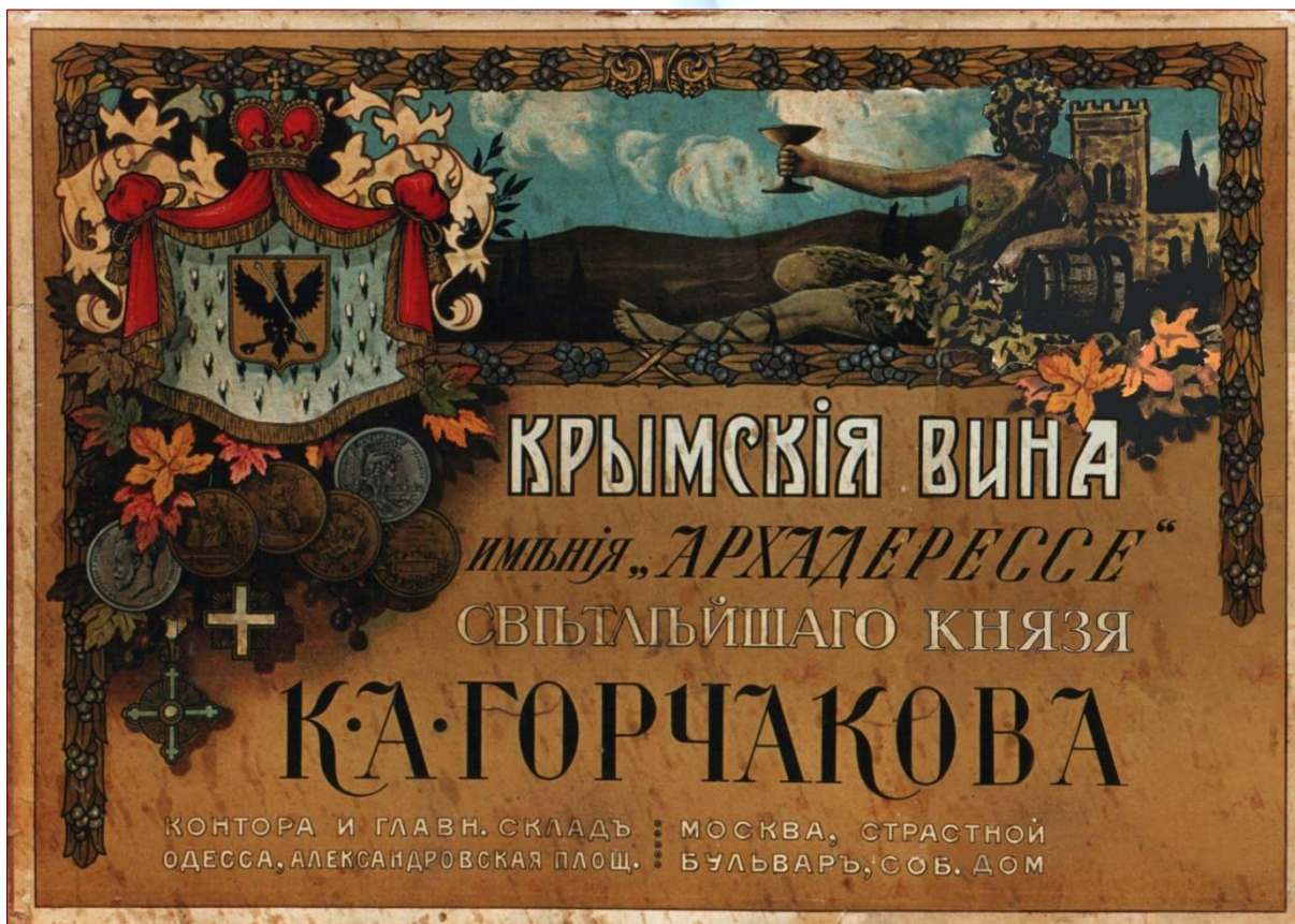
Яркий герб владельца винодельни, Дионис, абрис замка-винодельни и мягкие, теплые тона – классика маркетингового хода конца девятнадцатого века. Рекламный плакат «Архадерессе».

прибыль от винопроизводства – не значительной, удивительные винные открытия и достижения Голицына – малозначимыми, а его решение вкладывать большую часть прибыли в развитие вина – безумным. Голицын покидает Архадерессе и запускает на мировой небосклон две звезды величайшего уровня: хорошо всем известный винзавод «Массандру» и завод по производству шампанских вин «Новый Свет». Впервые в истории России появляется промышленное производство ликерных и десертных вин, базирующееся на высочайшем научном уровне, а Россия уверенно стремится войти в закрытый клуб лучших винодельческих стран