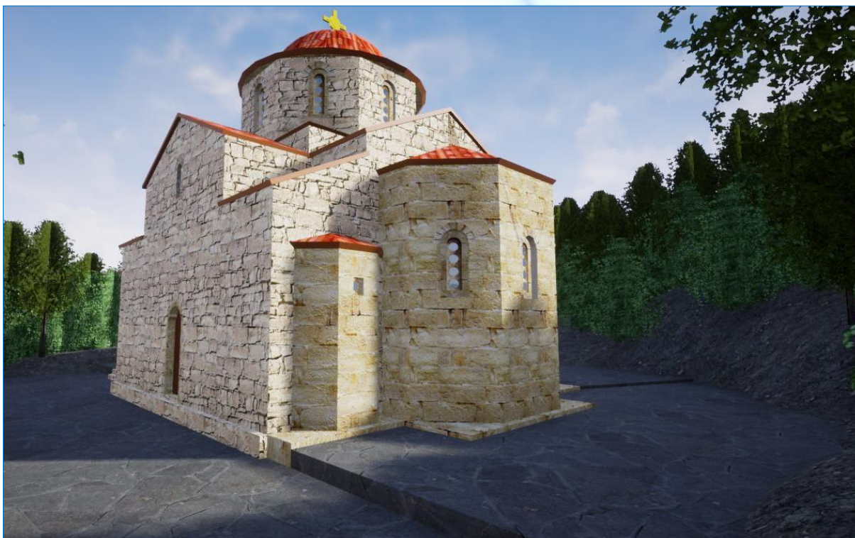
Реконструкция храма у Килиса-Кая. Найдены археологические подтверждения о прочной связи монастыря, где располагался храм, с Московским государством. Изображение размещено в свободном доступе: https://clck.ru/3AzrsD

смородины, как утешающее тепло истории, вернувшей Крым в объятия Христианской культуры и цивилизации.