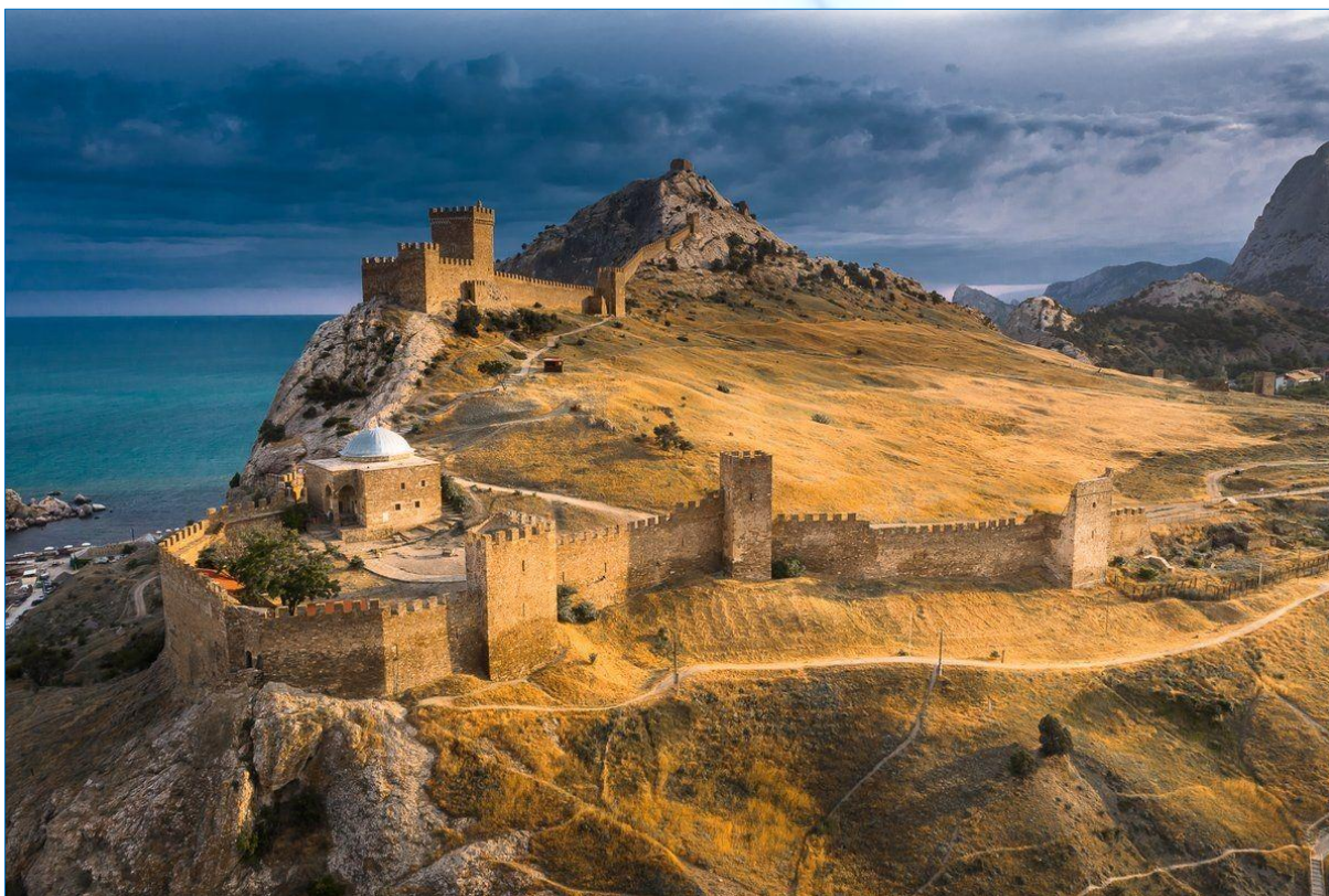
Крепость Солдайя – центр одноименного консульства.

Сотера (Sdafo) с генуэзским Алуштинским консульством» [Бочаров 2016: 265].