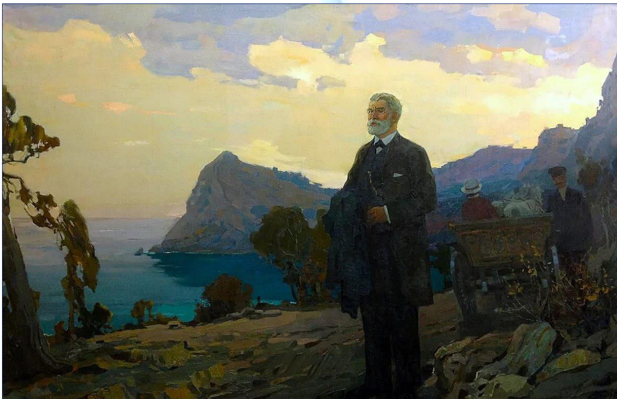
Отец русского виноделия, гений и бесребреник, князь Лев Голицын в Новом Свете. Прохоров К. Князь Голицын Лев Сергеевич (1966).

колоссальные средства (полтора миллиона полновесных царских рублей!) он развил очень бурную деятельность. Но когда годы спустя князь все-таки прибыл в свое имение, то увидел раскалённые скалы, душные долины, выжженное солнцем побережье, после чего пришел в бешенство и отстранил Голицына от дел. Ещё бы: взгляды столичного эстета и профессионала-винодела существенно отличались друг от друга.