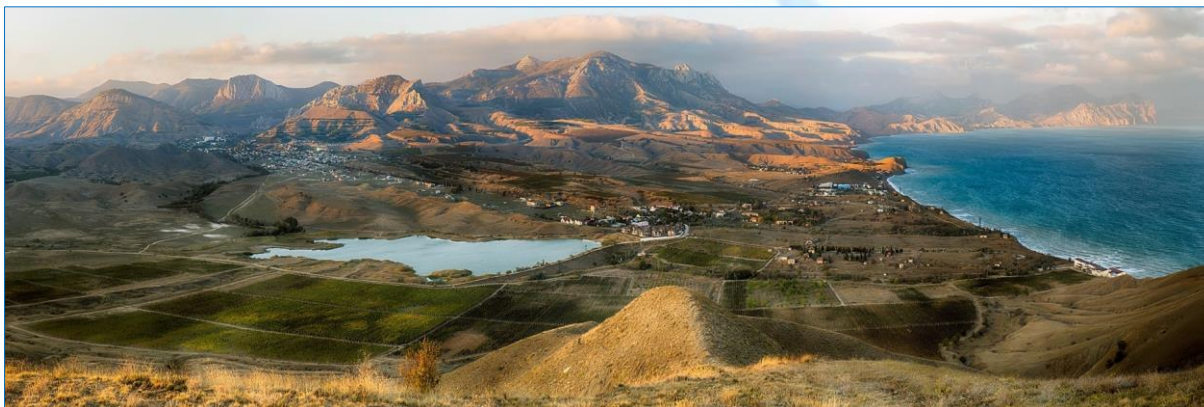
Терруар Солнечной долины в Крыму.

пределах Крыма, но в район, обладающий иным микроклиматом, резко обесценивает высокие свойства винограда, позволяющие создать истинные шедевры винного творчества.