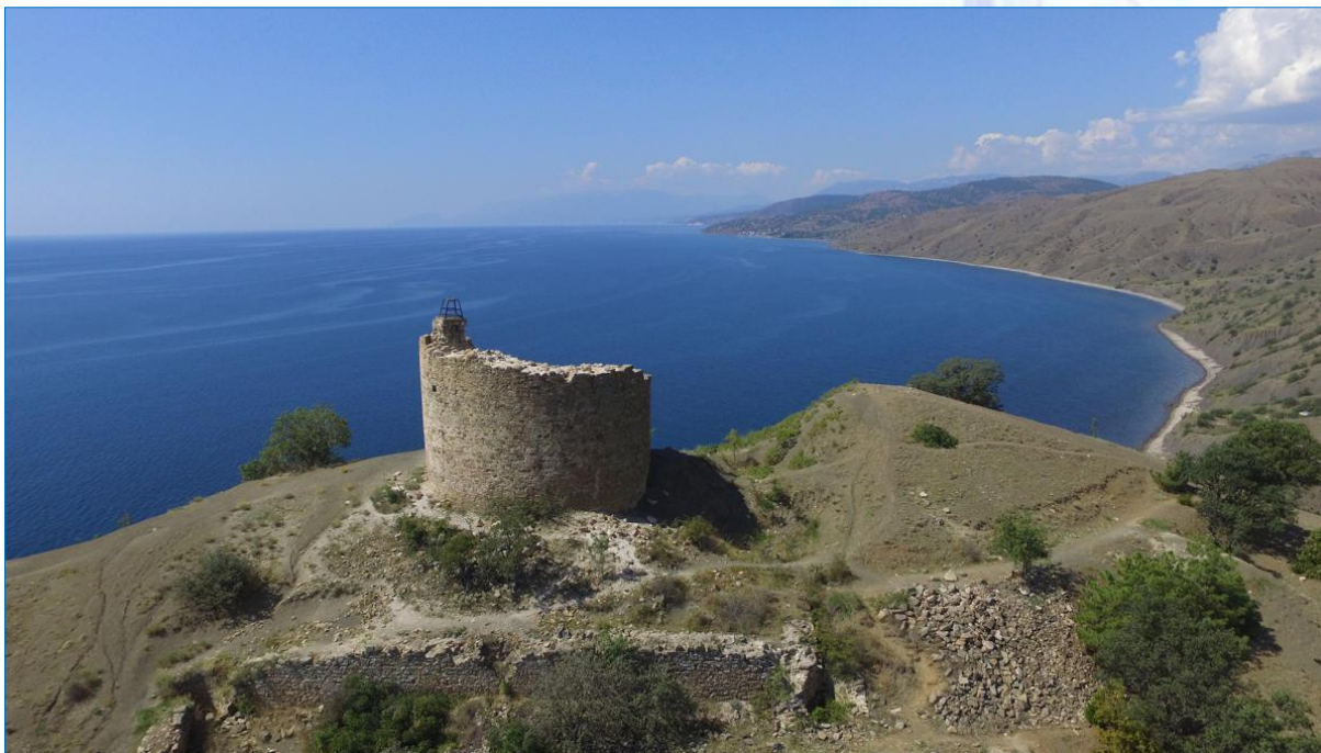
Чобан-Куле – развалины замка «Таксилы» принадлежавшего братьям Гуаско. Разбойничье гнездо, откуда терроризировалось крымское побережье от Судака до Алушты. Изображение размещено в свободном доступе: https://clck.ru/3AztZx

Здесь очень уместно вспомнить и обыграть истории, связанные с походом рыцаря Карло Ломеллино, или кровавой деятельности братьев-авантюристов Гуаско, которые конфликтовали с всесильными консулами Солдаи и Кафы: «Христофоро ди Негро, Антониото ди Кабела» [Дело братьев Гуаско 2022]. Вообще же история венецианцев (между прочим, близкие родственники известного Марко Поло имели в Крыму свое недвижимое имущество) и генуэзцев в Крыму дает интереснейший мифопоэтический материал диффузий разных культур в пределах небольшого географического региона: «Итальянские купцы появились, а затем усиливали позиции не просто мирно расселяясь, но и активно используя региональные противоречия...» [Чернышева 2019: 161].