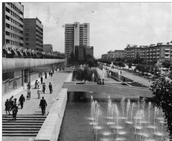
Луганск (1960-е гг.). Город неоднократно переименовывался в Ворошиловград, а именно в 1935 г. и 1970 г.

Подобный выбор обосновывается, во-первых, местом съемки и временем выхода указанных картин (Краснодон, Луганск, Антрацит, Боково-Платово). Во-вторых, возможностью представить разные аспекты визуально-кинематографического имиджа Луганского края. В-третьих, спецификой затрагиваемых тем. На большом экране Луганщина выступает активным действующим персонажем наравне с игравшими в фильмах актёрами, подчеркивая в своем характере революционные и трудовые традиции жителей.