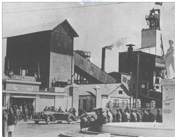
Краснодон до Великой Отечественной войны представлял собой небольшой шахтерский городок.