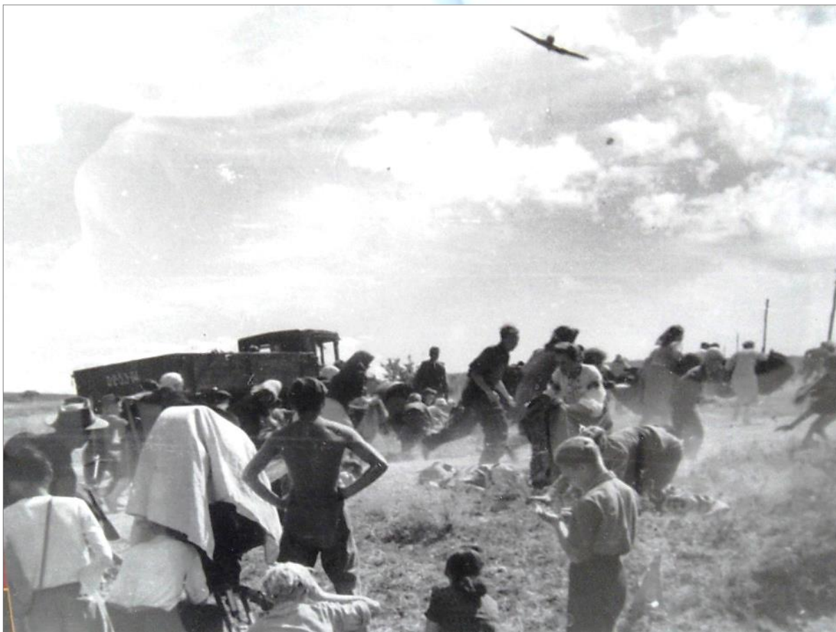
По следам съемок фильма «Молодая Гвардия» в городе Краснодоне, 1948 г. Изображение размещено в свободном доступе на сайте «Молодая Гвардия. Героям Краснодона посвящается...»: https://www.molodguard.ru/photos208.htm

Фильм зримо отражает патриотизм и стойкость жителей небольшого городка, которые преимущественно работают на шахтах. Главные герои, молодогвардейцы, олицетворяют собой мощнейший дух стойкости, сопротивления, героизма. Мужские образы главных действующих лиц киноленты выстроены на основе архетипов заботы (защита слабых и помощь страдающим от оккупации краснодонцам), героизма (участие в подпольной организации, требующее мужества, риска ради благородного дела) и простоты (юношеский максимализм в стремлении поступать