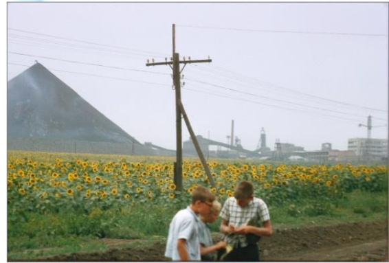
Поселок Платово.