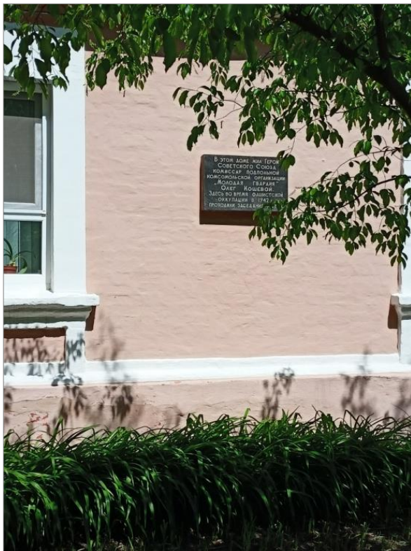
Дом Олега Кошевого, г. Краснодон, 2021 г.

Последующее восстановление города в финале ленты наглядно отражает тему надежды и возрождения. Показательно, что именно город Краснодон как «малая родина» активно формирует характер и судьбу членов «Молодой гвардии» и сам становится неотъемлемой частью повествования, полноценным символом жертвенности и героизма.