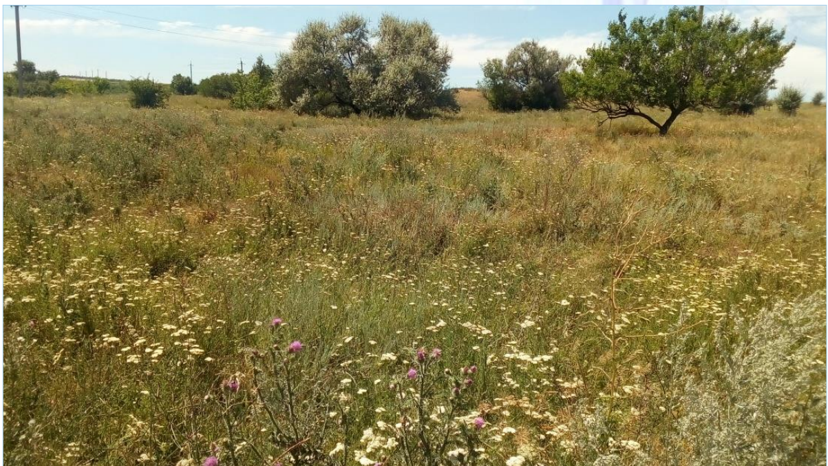
Луганская степь, лето 2023 г.

«Давно укрыли зверобой и мята Становиц тех остывшую золу. Здесь воин князя Игоря когда-то В траву случайно выронил стрелу. Вся в ссадинах земля звенит сухая. Чадит костер на земляном валу. И ветер, с тех времен не утихая, Качает оперенную стрелу» [Журавлева 2008b: 10].