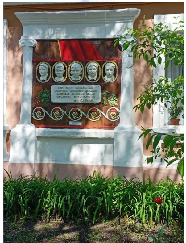
Памятная доска героям-молодогвардейцам, г. Краснодон, 2021 г.