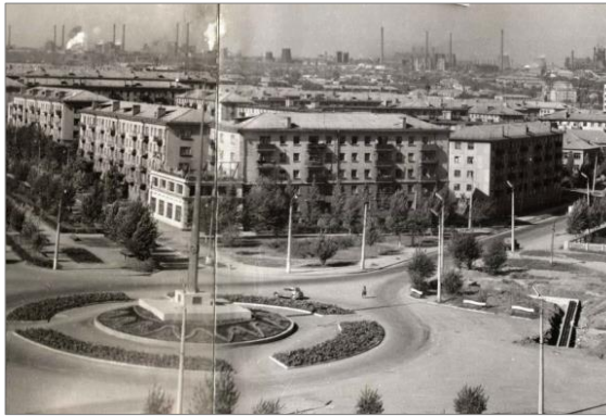
Вид на одну из длинных улиц города Алчевска – ул. Чапаева