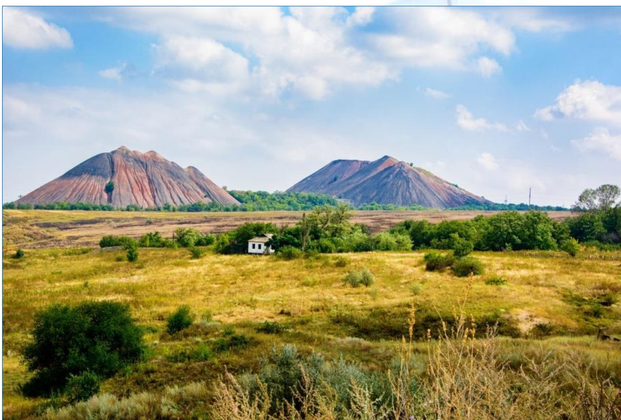
Типичный ландшафт Луганского края.

По мере приближения к символизации регионального пространства обнаруживается разнообразие культурного ландшафта, представленного специфическими мифопоэтическими символами: железные ромашки, высокие курганы, бегущая вдаль колея, горькая мята, пылающее небо и др.